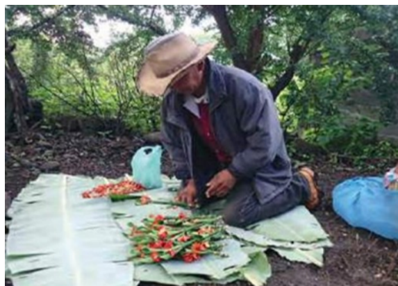
Imagen 38. Colocación de las hojas de plátano.

La cantidad de tamales que se preparan para la ofrenda es mayor a lo que cabe en los dos chiquigüites, por lo que el resto de los tamales son colocados en medio de la ofrenda. En la ofrenda también se pone un gallo viejo ya sin vida, al igual que dos velas, doce ramitos de flores, una cruz de palo y el sahumerio. Este último es un recipiente de barro que sirve para que se queme el carbón sobre el que se coloca el copal.