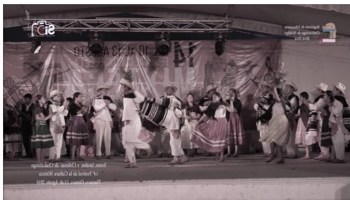
Imagen 5. Baile de chilena oaxaqueña

La chilena tiene una gran importancia para los habitantes de Chalcatongo. Forma parte de lo que escuchan, en su día a día, de manera tradicional. Forma parte de su cultura. Es lo que más disfrutan escuchar y, sobre todo, bailar.