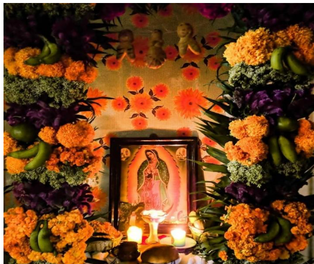
Imagen 34. Altar y arco con flores de cempasúchil

Por la tarde de ese día se vuelven a hacer los tamales para que al día siguiente, el dos de noviembre, se vuelva a ofrendar. Es el mismo proceso que el día anterior. Desde temprano se coloca la ofrenda en el altar y se hace el caminito. En este día también se visita a los padrinos y familiares para tamalearlos.