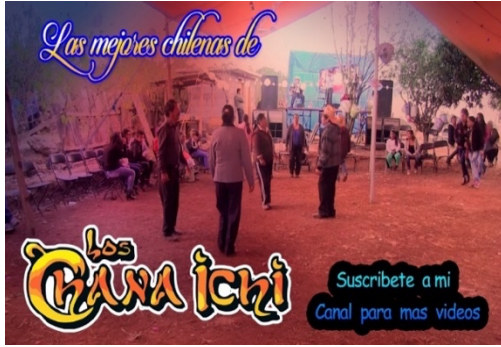
Imagen 9. Grupo Chana Ichi