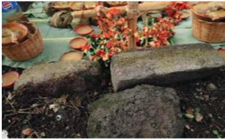
Imagen 36. Las dos piedras diferentes

ponen doce jícaras con pulque y dos chiquigüites de tamales “nejos” y tamales de frijol, uno de cada lado.