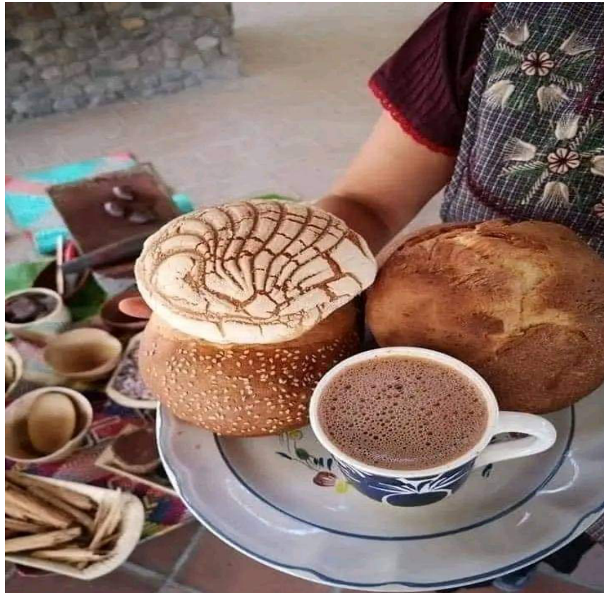
Imagen 22. El chocolate

Chcolatl es el nombre en náhuatl que se da al chocolate, en mi pueblo de Las Puentes, perteneciente al Municipio de Chicontepepec, en el Estado de Veracruz. Una de las tradiciones del pueblo es la preparación del chcolatl, para Xantolo, el día de muertos.