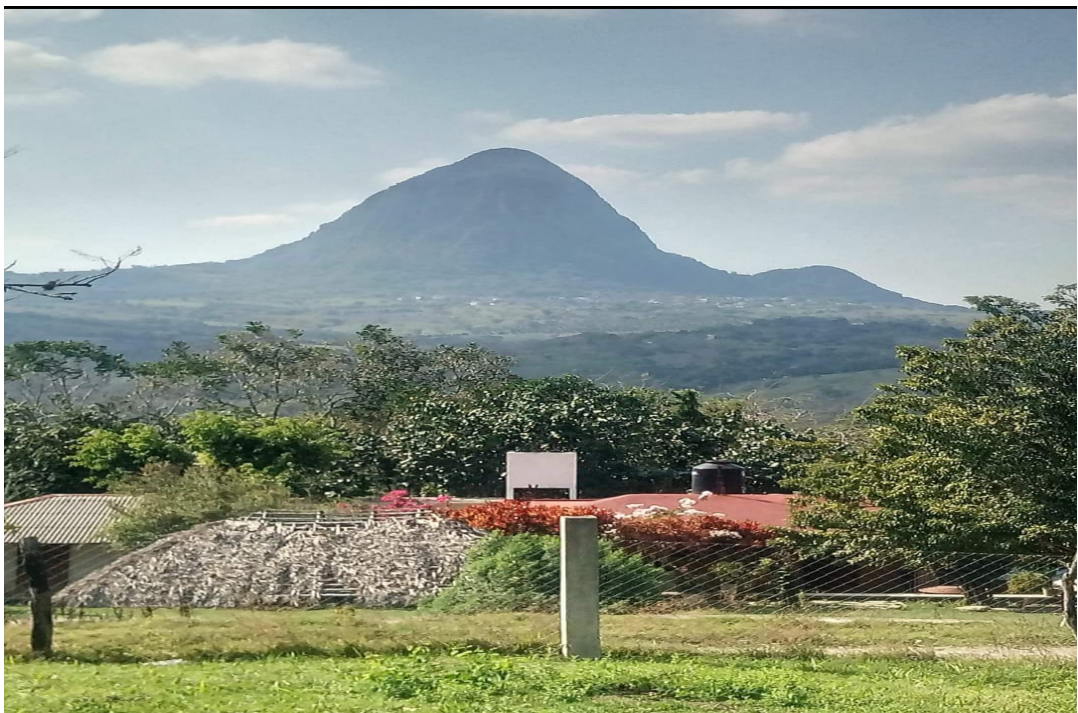
Imagen 23. Paisaje de mi comunidad

No hay una expresión o un sentir que se pueda transmitir al sentimiento. Las emociones de seguir con las costumbres y tradiciones. Simplemente es algo que representa la huasteca veracruzana. Es nuestra esencia, lo que somos y representamos en nuestros sentir, emociones, saberes y una gran riqueza gastronómica.