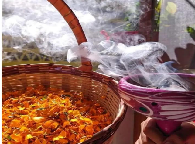
Imagen 32. Pétalos de cempasúchil e incienso

A las 8 de la mañana se comienza a hacer un caminito de pétalos de flor de cempasúchil, de la carretera hasta el altar de la casa. Se realiza con una vela e incienso en un copalero. Esto lo suelen hacer los niños de la casa según, sea el caso.