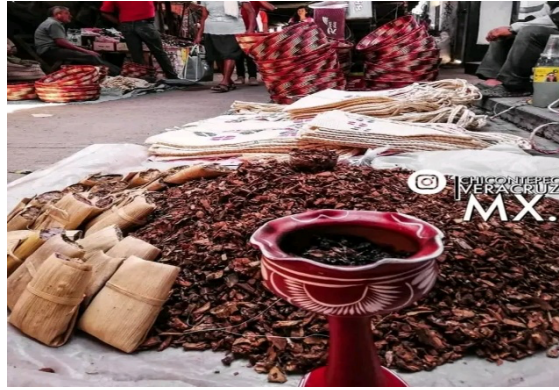
Imagen 30. Día de plaza en Tlacolula

Al último martes de octubre se le conoce como martes grande de cerca , porque en este día se compran las cosas que pueden durar menos tiempo, como: el pan dulce, el frijol chichimikero, el ajonjolí, la yerbabuena, el xonakate, y las flores.