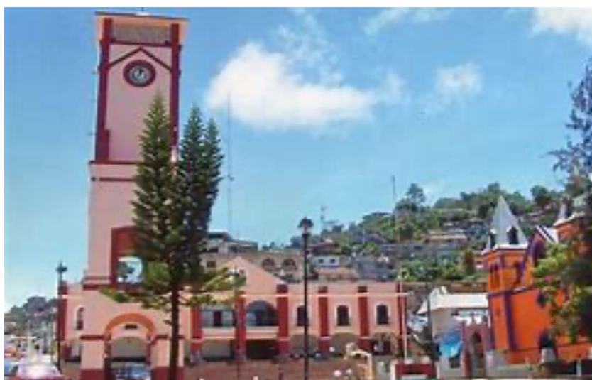
Imagen 18. Iglesia de Huatla de Jiménez

La comunidad en donde nací y crecí se llama Huautla de Jiménez, Oaxaca. Es un pueblo mazateco que se ubica en la región Cañada del Estado de Oaxaca. Su nombre hace referencia al lugar de las águilas. Dentro de la comunidad se habla el mazateco, variante cho'ta ennima.