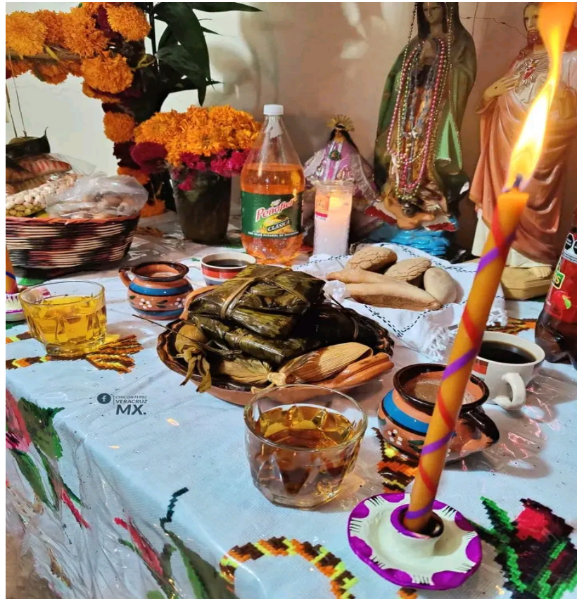
Imagen 25. El chocolate en la ofrenda

guajillo y en hojas de plátano. El pan es elaborado por los mismos vecinos de la comunidad o por la familia. Algunos panes tradicionales son: el capricho, san pan, revuelta, de piloncillo, pemol y pan de camote.