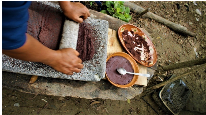
Imagen 24. Cómo se muele el chocolate en el metate

Estas son las cantidades que se ocupan cuando se compra un kilo de cacao.