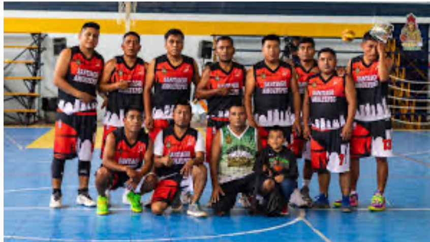
Imagen 3. Jugadores de Santiago Amoltepec

personas sienten que en el basquetbol se olvidan todas las preocupaciones y tristezas. Es donde el cuerpo se cansa, pero la mente descansa. Ayuda a tener buena condición física y salud; abre puertas para nuevas oportunidades.