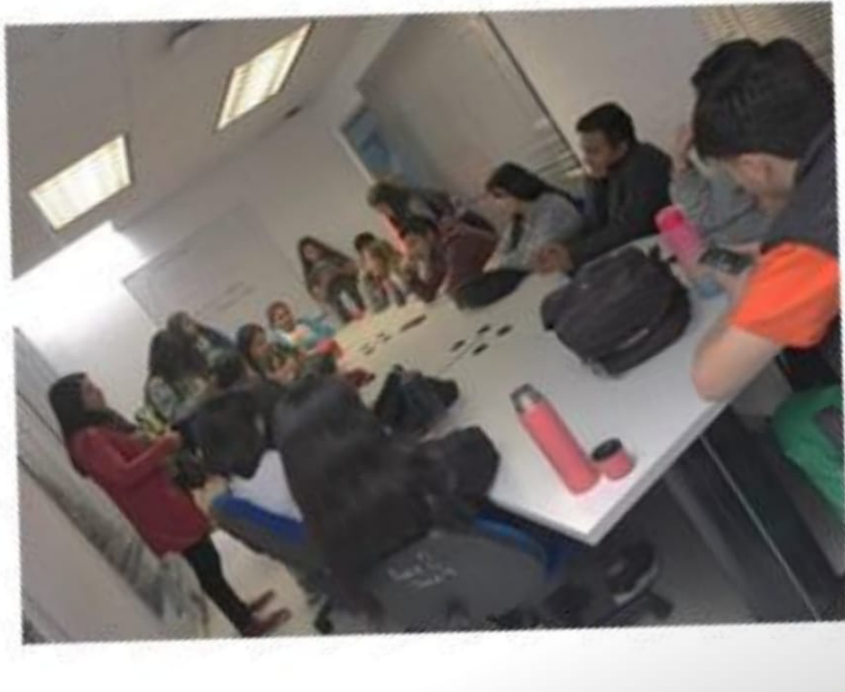
Imagen 27. Junta de Alumnos Indígenas UPN

Impacto en la Salud y Bienestar: Los estudiantes Indígenas al cambiar de región suelen notar cambios en la ciudad de México en ésta suele haber bastante contaminación, por esta razón pueden enfermarse constantemente.