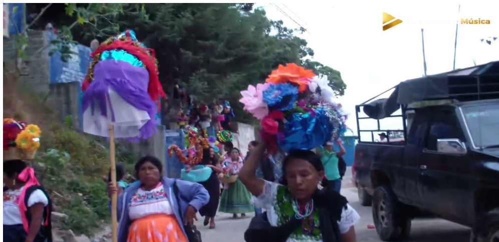
Imagen 1. Calenta de Santiago Amoltepec

En La Calenta, algunas mujeres se visten con ropa típica y cargan canastas adornadas con flores y llenas de dulces. Van a la casa de la persona que está encargada de preparar el café y pan para todos los individuos que gusten acompañarlos al recorrido que se hace, para llegar a la iglesia y asistir a la misa. Una vez que hacen el recorrido, todos se reúnen en el palacio municipal. Ahí, bailan con los toritos que son castillos pequeños hechos de carrizos, azúcar y pólvora. Después, se regalan los dulces que contienen cada una de las canastas, a todas las personas que los acompañan. El baile se termina hasta las 12:00 pm de la noche.