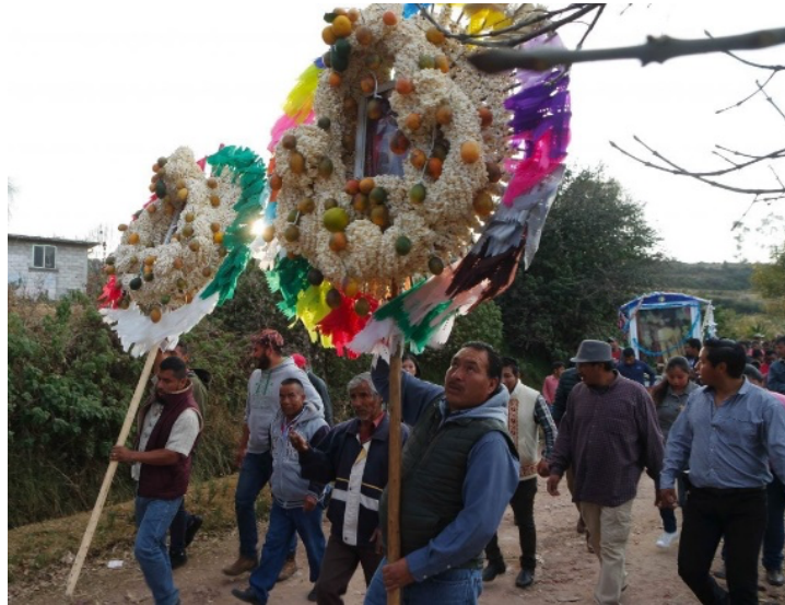
Imagen 15. Corona hecha con palomitas de maíz

Día 28 de junio se realiza un recorrido, a las diez de la mañana, de la iglesia al pueblo de San Francisco (al este de la comunidad), que dura dos horas de camino. La gente de la comunidad va acompañando a las imágenes de los santos patronos. Atrás de ellos van los estandartes de los diferentes grupos parroquiales. Después siguen las personas que llevan cargando las veladoras en cajones grandes, con muchos adornos. Van bailando al ritmo de la música.