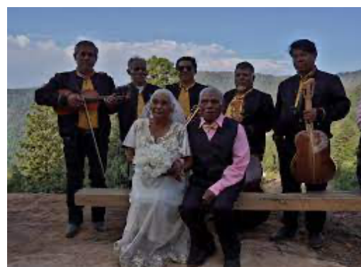
Imagen 6. Celebración de una boda

En la forma tradicional de tocar las chilenas, se utiliza el violín, la guitarra, la vihuela, el guitarrón, el tololoche, y la voz. Actualmente, algunos grupos tocan las chilenas incluyendo instrumentos nuevos como: la trompeta, el acordeón o los teclados. Este último es uno de los instrumentos más utilizados por muchos grupos musicales de la región.