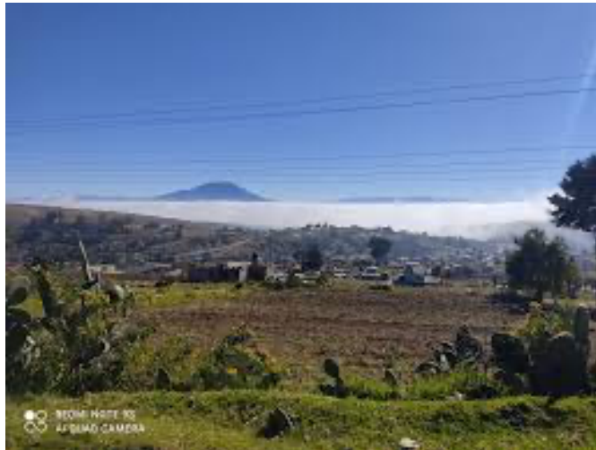
Imagen 13. Vista del pueblo

En el ejido se practica la agricultura de temporal. Los campesinos cultivan maíz criollo, identificando seis variedades de maíz: (1) blanco, (2) amarillo, (3) azul, (4) rosado, (5) pinto y (6) cacahuacintle.