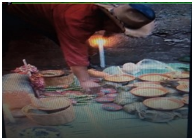
Imagen 39. Colocación de la comida.

Cuando se pone la ofrenda de la piedra, quienes preparan todo son las familias que tienen la piedra. Inicia un día cuando se consiguen todos los materiales necesarios para la ofrenda. En la preparación de la ofrenda participa toda la familia también, los compadres y vecinos que la familia invita. Nadie queda fuera incluso se hacen participar a los niños. Ellos deben irse familiarizando para que, en un futuro, sean ellos quienes realicen el ritual.