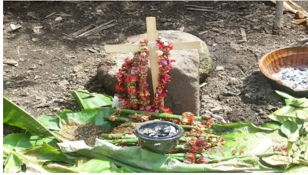
Imagen 41. Ya se quitó las cosas de la ofrenda

Terminando de quitar las cosas de la ofrenda, la familia se dispone a repartirlo para comer. Acabando de comer, la señora de la casa, que es la abuela, decide repartir la comida. Reparte el mole en cubetas de un litro y los tamales. De esa forma se les agradece a las personas que ayudaron a preparar los tamales y el mole.