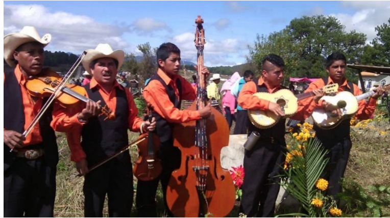
Imagen 8. Grupo musical con instrumentos tradicionales de las chilenas

Los grupos musicales se conforman de la misma gente del pueblo, y de las agencias que son parte de Chalcatongo. Cada grupo está conformado mayormente por el núcleo familiar de hombres de cada familia, teniendo algunas excepciones en donde se admiten amigos, o conocidos.