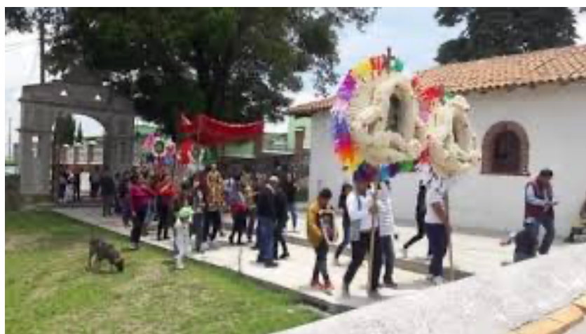
Imagen 14. Entrada de coronas a la iglesia

La festividad es una forma, de darle gracias a los santos apóstoles, por el trabajo que nos bendice durante el año transcurrido. Se agradecen las buenas cosechas de maíz que pudieron cosechar en el año, por el bienestar de la salud de las familias y, en general, se les agradece por las bendiciones recibidas durante todo el año.