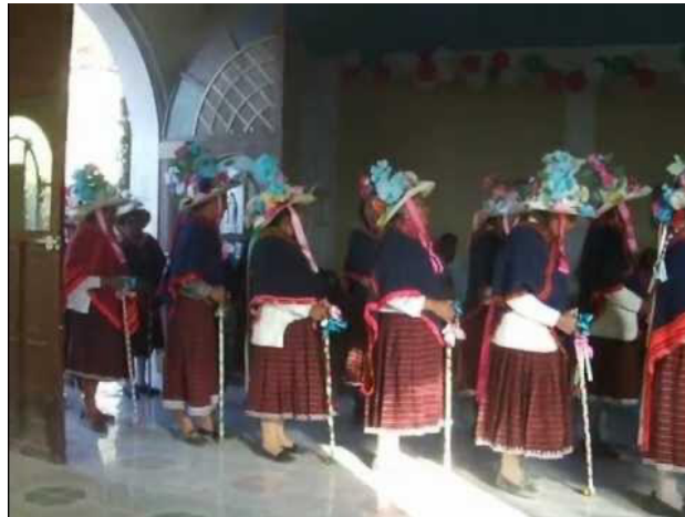
Imagen 16. Danza de las pastoras

El 29 de junio se realiza otro recorrido que sale a las diez de la mañana de la iglesia y van en dirección a ñiñi (al norte del pueblo). Así como se hizo el día anterior, al llegar también hay una celebración de misa, la carrera de caballos, la danza de las pastoras y los santiagueros, muchos puestos de comidas y bebidas para consumir.