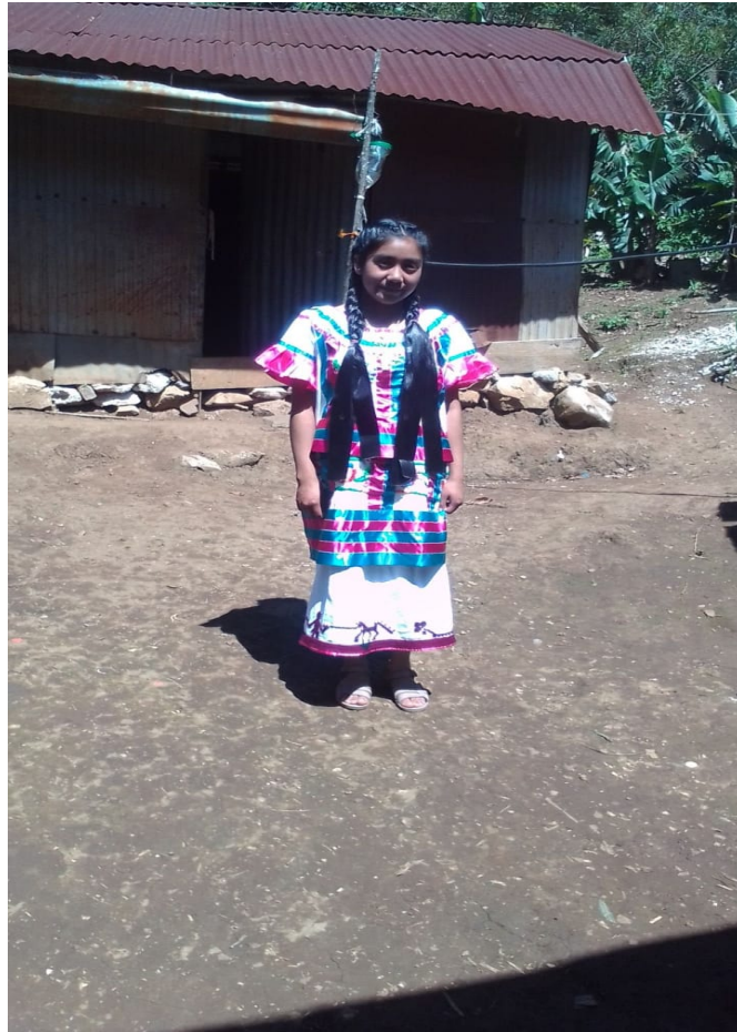
Imagen 21. Ejemplo de cómo se usa el huipil con la enagua

Los materiales que se necesita son tela cuadriller, hilo, aguja, tijeras, hoja de dibujos en punto de cruz, listones de color rosa y azul.