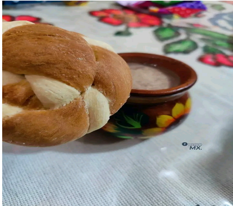
Imagen 26. Así se toma el chocolate