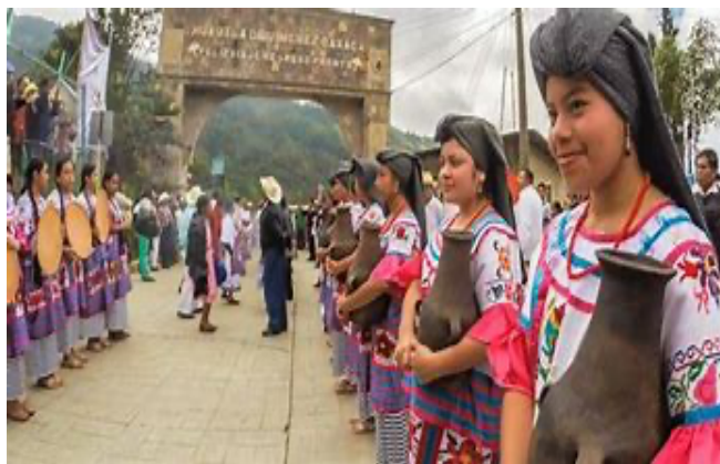
Imagen 17. Entrada de Huautla de Jiménez

La comunidad en donde nací y crecí se llama Huautla de Jiménez, Oaxaca. Es un pueblo mazateco que se ubica en la región Cañada del Estado de Oaxaca. Su nombre hace referencia al lugar de las águilas. Dentro de la comunidad se habla el mazateco, variante cho'ta ennima.