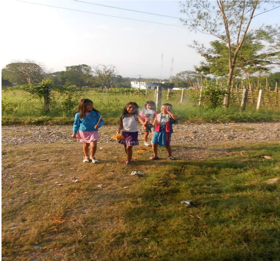
Imagen 33. Mi hermano, mis primas y yo haciendo el caminito para guiar a las ánimas

prenden las velas, se copalea con incienso y se bendice la comida con el agua bendita.