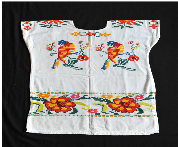
Imagen 19. Ejemplo de Huipil

En la comunidad, el huipil representa una forma de acercarse a la naturaleza y a la vida. El huipil mazateco tiene un profundo significado para las mujeres de Huautla de Jiménez Oaxaca, pues representa la identidad y la herencia de muchas generaciones. Cada uno de los detalles que se plasma en el huipil tradicional tiene significados importantes en la vida de cada familia huastleca.