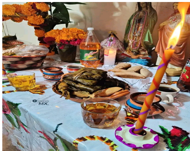
Imagen 29. Altar con la ofrenda de Xantolo

Otras de las cosas que debe llevar la ofrenda, para Xantolo, es la comida. Son tamales de pollo o de puerco, el paskal (comida a base de pasta de ajonjolí), mole, dulce de ajonjolí, calabazas dulces, atole de chocolate, y pan dulce. El agua bendita, el incienso y las velas son lo que caracteriza a la ofrenda y es muy importante. Las familias se preocupan por adquirir estos artículos en fechas posteriores, como se explica más adelante.