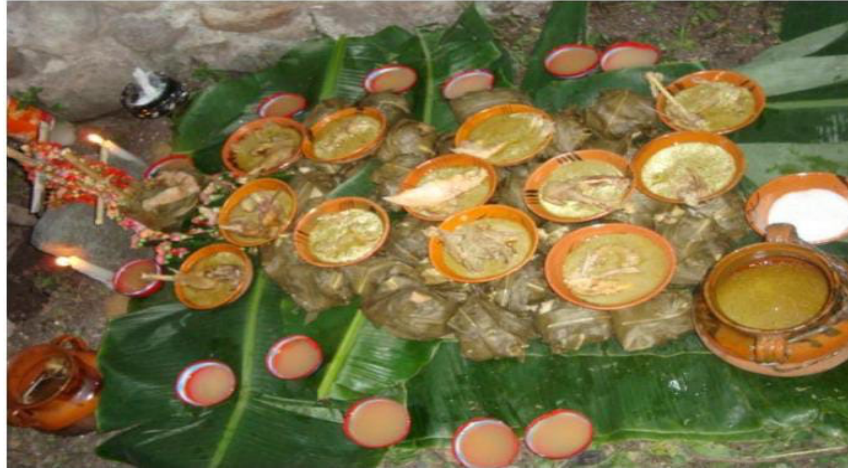
Imagen 40. La ofrenda del milakua durante los actos de llamamiento y agradecimiento

Durante el mes de agosto y septiembre es cuando se agradece a los entes de la naturaleza por las buenas cosechas de la temporada. Este agradecimiento lo realizan pocas familias de la comunidad y consiste en devolver un poco de lo que la madre tierra nos regala, como en el caso de milakua.