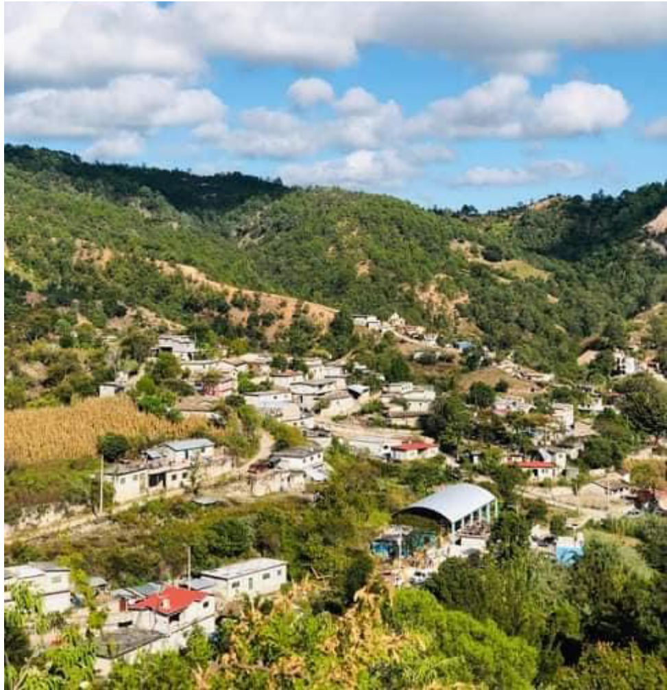
Imagen 11. El pueblo de San Andrés Montaña

interpretación de los sueños. Lo primero que se va a identificar es el tipo de sueño, siendo ésta la última etapa.