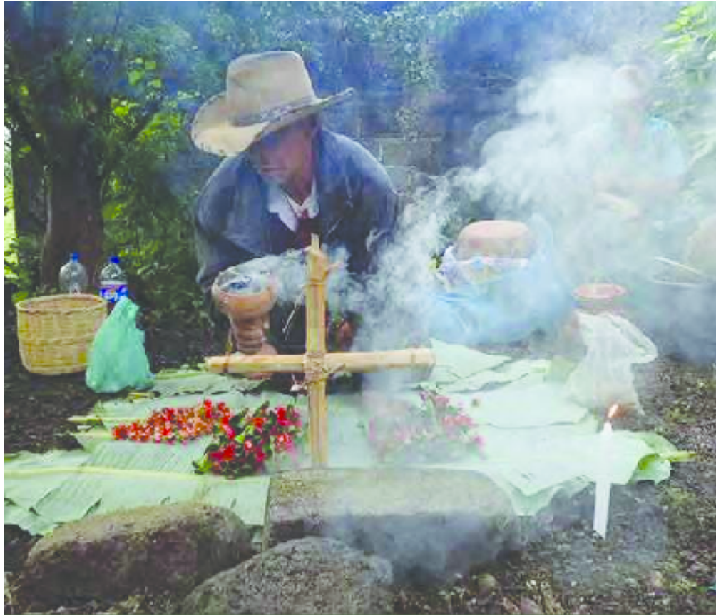
Imagen 35. Ritual de la piedra de Cuatepec

Milakua es el nombre náhuatl de un ritual que se realiza en el pueblo de Cuatepec, en el estado de Morelos. Consiste en poner una ofrenda a una piedra sagrada, en una casa. Existen diferentes casas en la comunidad de Cuatepec que tienen una de estas piedras.