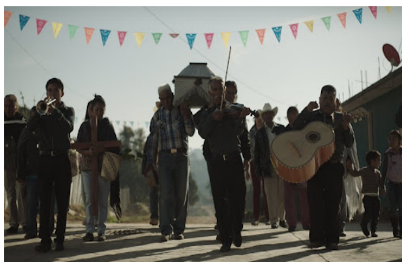
Imagen 7. Entierro

Las chilenas se hacen sonar en la mayoría de las festividades del pueblo: en las graduaciones, las bodas, los cumpleaños, los velorios y los entierros. También, por supuesto, en las fiestas más grandes como: el carnaval, las fiestas patronales y la fiesta principal del pueblo.