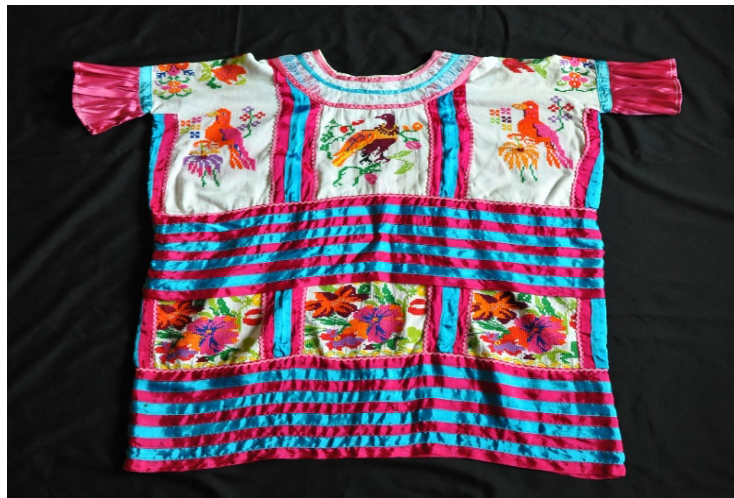
Imagen 20. Ejemplo de huipil de Huautla

Cada uno de los iconos que se encuentran plasmados en el huipil son pájaros, flores y hojas que día a día encontramos en nuestro entorno. Los pájaros representan todas las especies de pájaros que hay en la comunidad. Ellos se encargan de cantar todos los días al amanecer. Las flores representan todas las flores que se siembran en la comunidad. Todos estos iconos representan la riqueza de la flora y la fauna de Huautla de Jiménez. Los siete listones de la parte superior indican los días de la semana y en la parte inferior nueve listones se refieren a los meses de gestación.