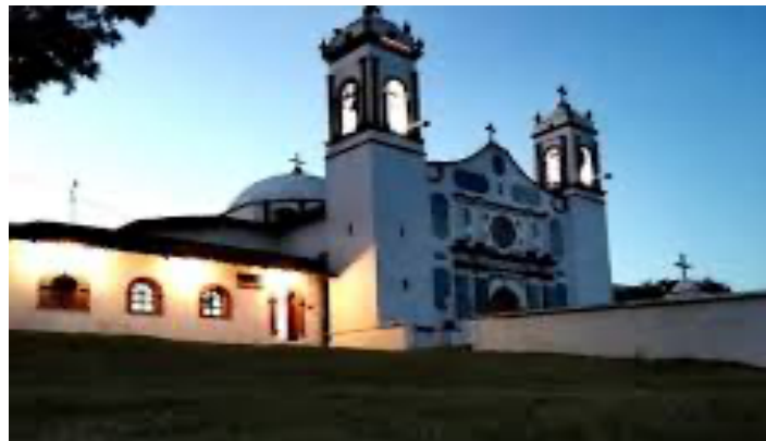
Imagen 12. Iglesia San pablo Tlalchichilpa

San Pablo Tlalchichilpa es un pueblo ubicado en el Estado de México, en el municipio de San Felipe del Progreso. La fiesta patronal del pueblo es en honor a los santos San Pedro y San Pablo. Se les venera porque gracias a estos dos hombres la iglesia se mantuvo unida. Se dice que Pedro fue el signo de unidad por su fidelidad y fe en Jesús. Ello motivo a los demás cristianos a seguir sus enseñanzas. En lo que respecta a Pablo, él comienza a anunciar el evangelio. Esta historia inspiró a la integración de la comunidad. Es una festividad que recalca el catolicismo en la comunidad. Es una comunidad indígena hablante del idioma Mazahua.