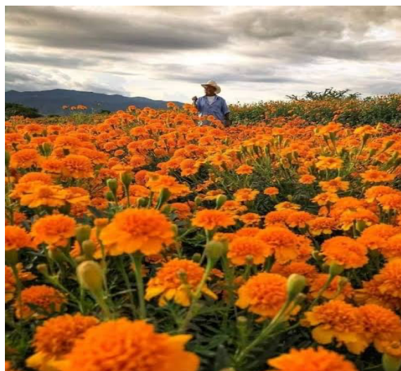
Imagen 31. Flor de cempasúchil en la milpa

En algunas familias, las cosas para Xantolo las cosechan de la milpa o incluso del patio de su hogar. Se suele ir por el frijol, ajojolí, las hojas para los tamales, algunas frutas y las flores se van a cortar un día antes de Xantolo, para que no se marchiten. Y para las familias que no tienen estas cosas, como ya antes se mencionó, optan por comprarlas, ya sea en la plaza o con sus vecinos.