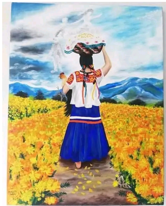
Imagen 28. Mujer indígena de la huasteca con traje típico

Xantolo es el nombre que se le da al día de muertos en la región de la huasteca baja de Veracruz. Yo soy de una comunidad indígena llamada Las Puentes, Chicontepec. Este nombre viene de la expresión chicome (siete) tepetl (cerro) que en Náhuatl significa siete cerros. Se trata de siete cerros se encuentran en esa región. A Xantolo también se le conoce como la fiesta de las ánimas.