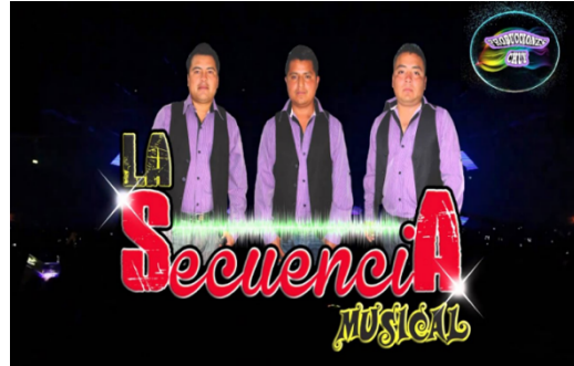
Imagen 10. Grupo La Secuencia Musical

Los grupos musicales de Chalca buscan plasmar en sus canciones el amor que le tienen a su tierra, tanto el aprecio a la belleza de la región como el de las mujeres. También hay letras que hablan sobre las actividades que realizan día con día.