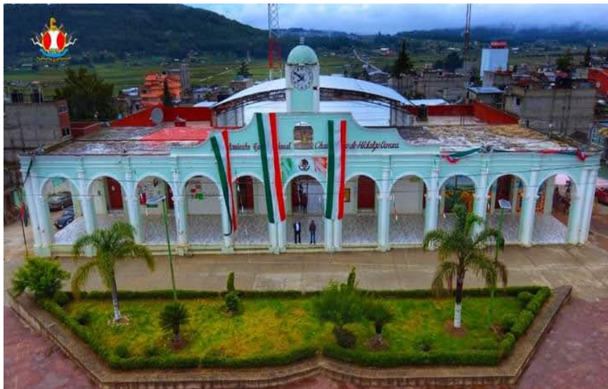
Imagen 4. Municipio de Chalcatongo

El Municipio de Chalcatongo de Hidalgo es uno de los 570 municipios en que se encuentra dividido el estado mexicano de Oaxaca. Pertenece a la región de la Mixteca Alta. El Mixteco es su lengua originaria, aunque actualmente se usa más el español. De cariño, los jóvenes y algunos habitantes usan la expresión “Chalca” para referirse a este Pueblo.