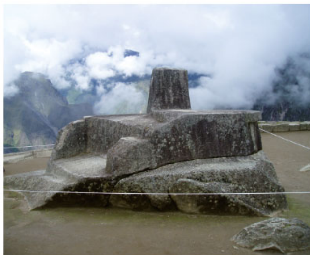
Reloj solar, Machu Picchu, Perú.

Entra al portal Primaria TIC: < http://basica.primariatic.sep.gob.mx >. En la pestaña Busca, anota Incas .