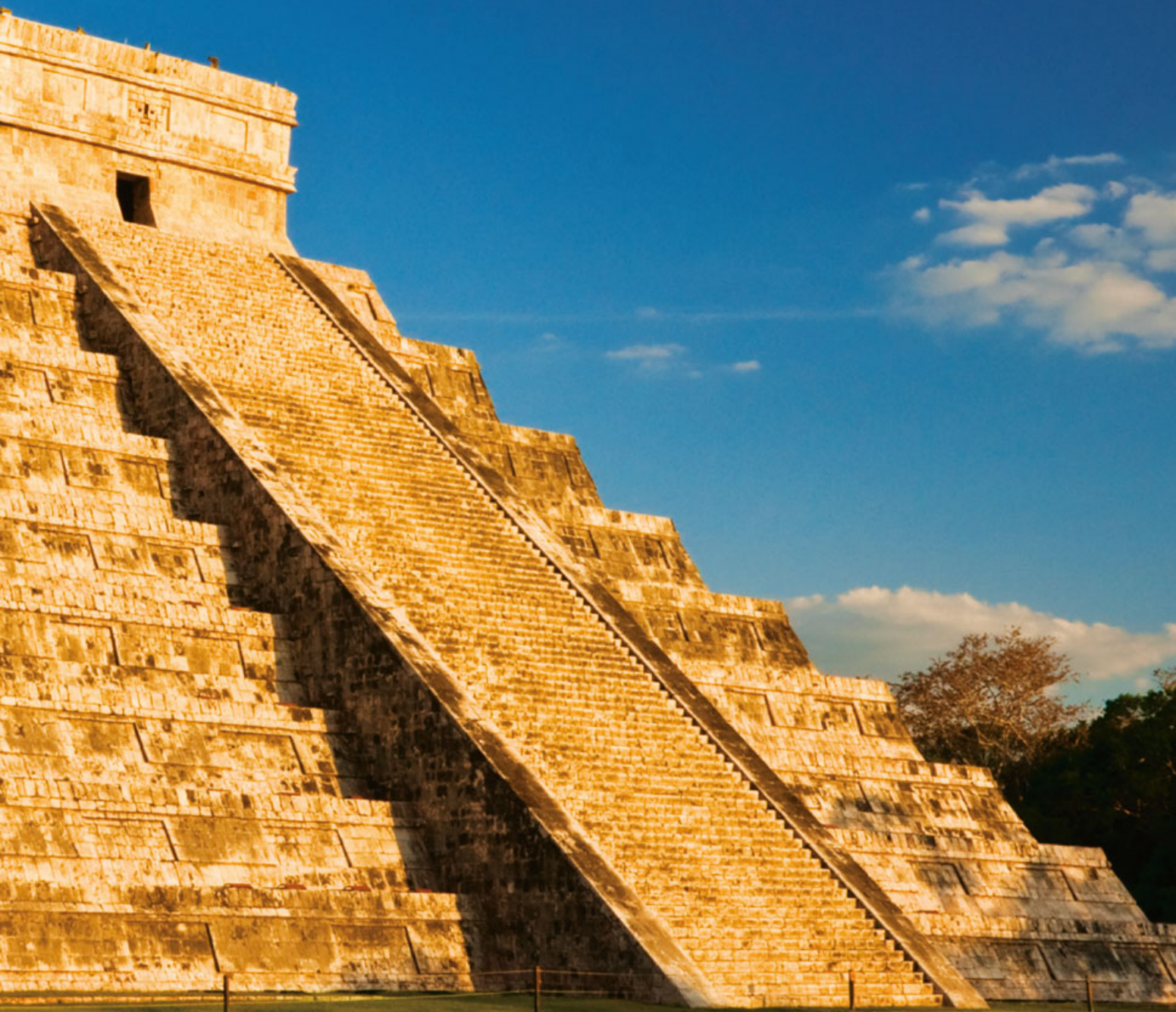
Pirámide de Chichén Itzá con efecto de serpiente, Yucatán.