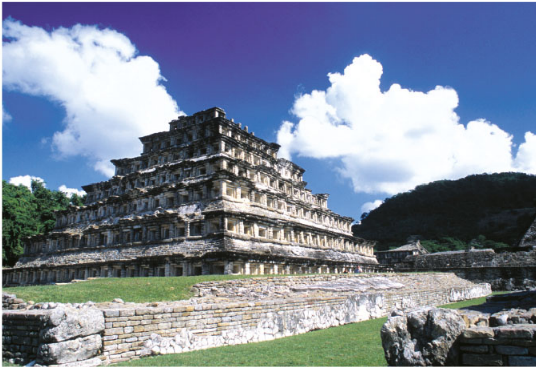
Pirámide de los Nichos, El Tajín, Veracruz.