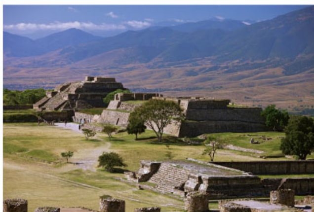
Monte Albán, Oaxaca.