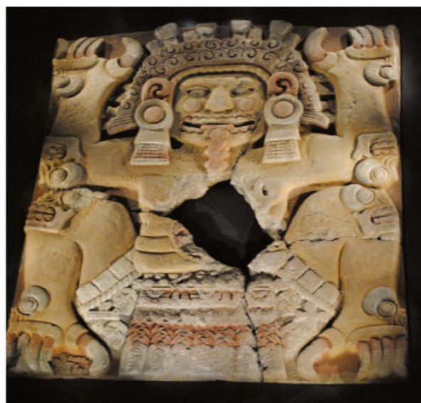
Tlaltecuhltli, “señora de la tierra”. Museo del Templo Mayor.

A través de sus mitos intentaron explicar la complejidad del mundo natural y del humano, tratando de preservar la armonía entre ambos. Así pueden entenderse los rituales que incluían diversas formas de sacrificio humano.