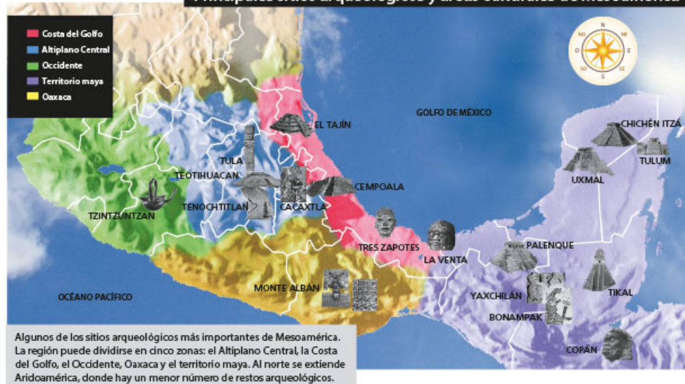
Principales sitios arqueológicos y áreas culturales de Mesoamérica