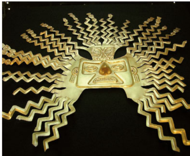
Máscara de oro con la representación del Sol.