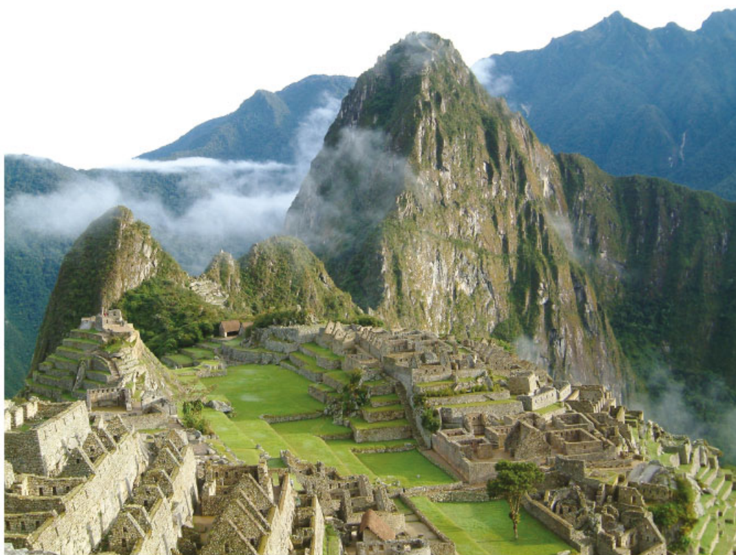
Machu Picchu, Perú.