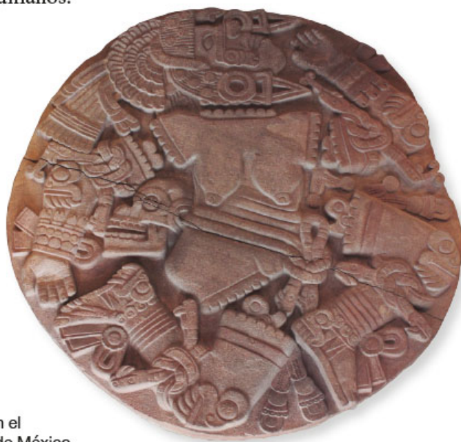
Representación de la diosa Coyolxauhqui, encontrada en el Templo Mayor en la Ciudad de México.