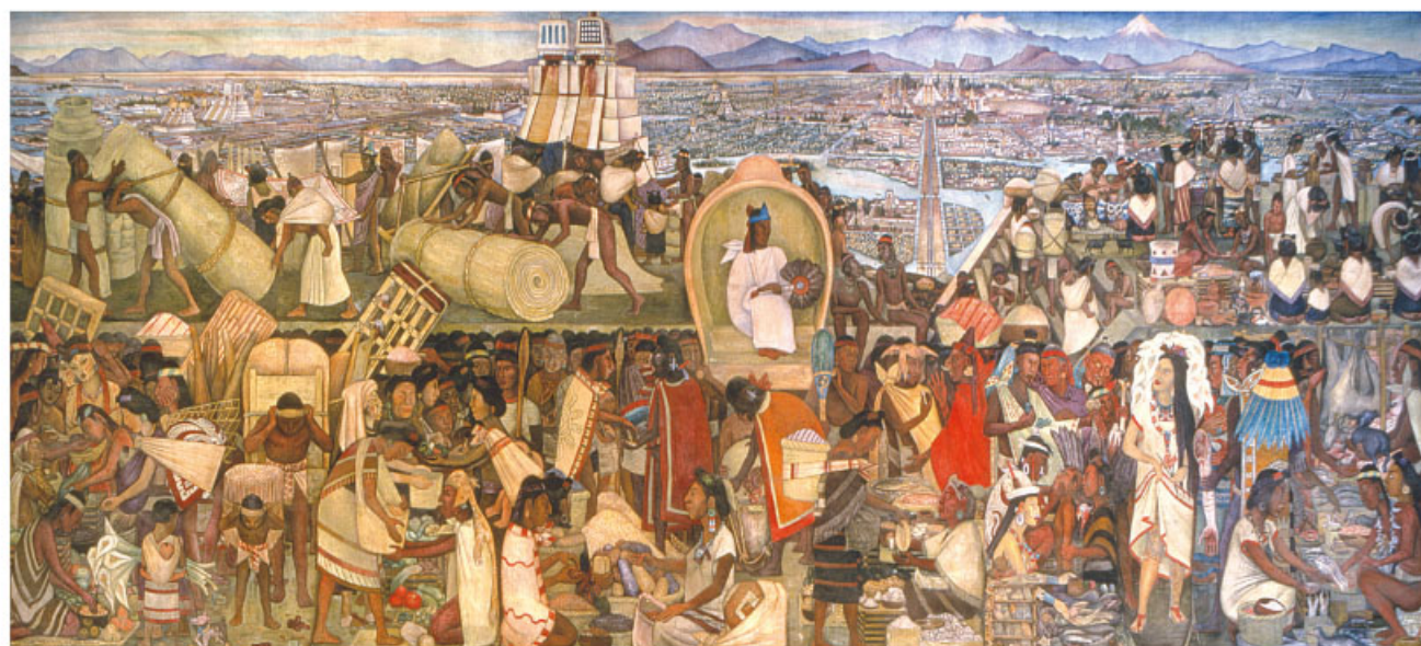
La gran Tenochtitlan vista desde el mercado de Tlatelolco. Pintado por Diego Rivera en 1945, Palacio Nacional.

Chinampa. Tejido de varas en áreas lacustres donde se deposita lodo para formar un islote artificial, para uso tanto agrícola como urbano.