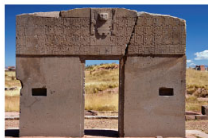
Puerta del Sol, Tiahuanaco.

A lo largo de la cordillera de los Andes, entre los años 1 200 a. C. y 1 400 d. C., se desarrollaron culturas previas a los incas, que se caracterizaron por el cultivo de papa, maíz y algodón; la domesticación de llamas y alpacas, que los proveían de lana y servían como transporte de carga; la producción de cerámica y joyería; y la construcción de centros ceremoniales, incluyendo las famosas líneas de Nazca, geoglifos sólo perceptibles desde una vista lejana o aérea.