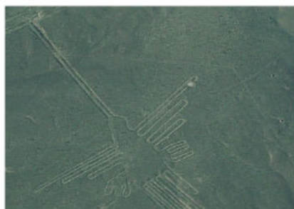
Geoglifo de la cultura nazca, Perú.

Además de la cerámica y el arte plumario, destacaron en la elaboración de diversos textiles (como ponchos , que usaban en su vestimenta, y tapices de algodón y de lana de alpaca), en algunos de los cuales plasmaron parte de sus creencias religiosas.