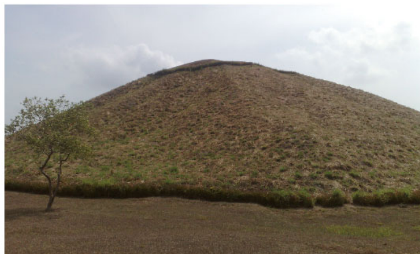
Pirámide de La Venta, Tabasco.

Entra al portal Primaria TIC: < http://basica.primariatic.sep.gob.mx >. En la pestaña Busca, escribe Olmecas: arte u Olmecas: territorio .