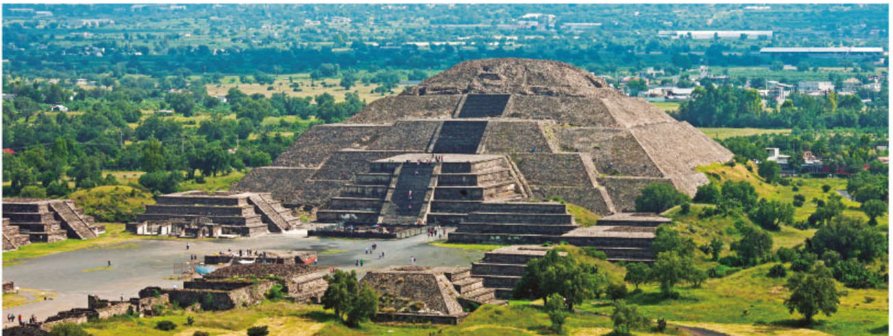
Vista contemporánea de Teotihuacan, que fue una de las ciudades más pobladas de Mesoamérica.

Teotihuacan se convirtió en la ciudad principal de Mesoamérica en este periodo. Estaba situada en el Altiplano Central, lo que permitió a sus habitantes aprovechar recursos naturales, como la obsidiana, para fabricar armas, herramientas y utensilios. Además, tuvieron acceso a sitios alejados gracias a su red de caminos. Sus ritos estaban dirigidos a los dioses de la lluvia y la fertilidad, posteriormente conocidos como Tláloc y Quetzalcóatl (“serpiente emplumada”).