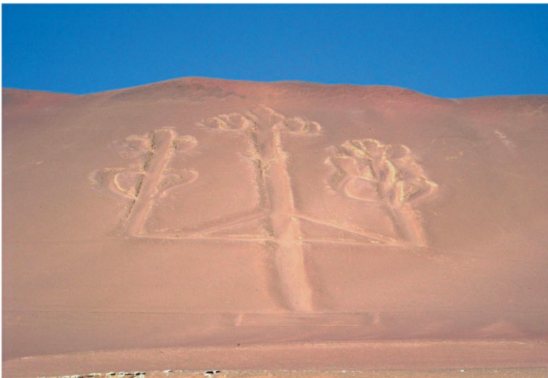
Vista aérea de un conjunto de figuras trazadas en la arena. Cultura nazca, Paracas, Perú.