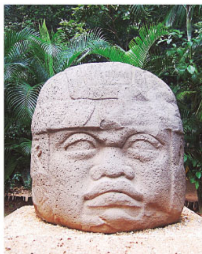
Cabeza de un gobernante olmeca.