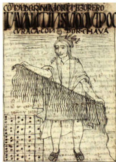
Contador inca con quipu.