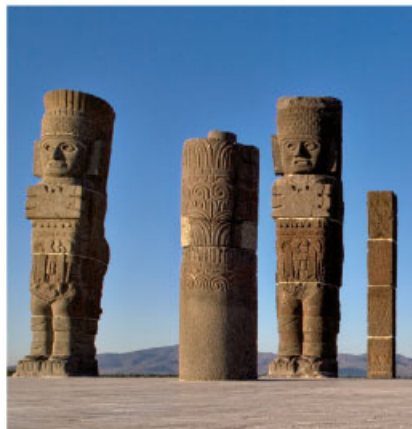
Atlantes de Tula, Hidalgo.

Hacia mediados del siglo XIV, los aztecas llegaron al valle de México. Según el mito, provenían de un lugar del norte llamado Aztlán, y retomaron elementos de otras culturas, como la teotihuacana y la tolteca. Se les ha llamado el pueblo del Sol porque era el astro que más veneraban. Creían que su dios, Huitzilopochtli, los había elegido para mantener vivo al Sol, alimentándolo con sacrificios humanos.