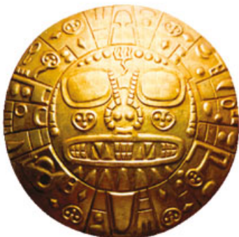
Placa inca del Sol.

Los mexicas y los incas tuvieron características en común: el dominio de amplios territorios, sus avances tecnológicos, sus creencias religiosas, la agricultura como base de su economía y el trueque como base del comercio. Asimismo, ambas culturas fueron conquistadas por los españoles en la primera mitad del siglo XVI, quienes mantuvieron su organización para colonizar sus territorios.