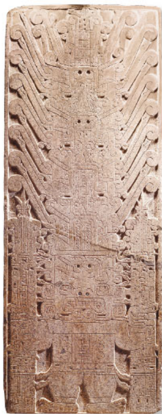
Divinidad con rasgos humanos y felinos, cultura chavín.

Geoglifo. Figura de enormes dimensiones construida en planicies o en laderas de cerros. Se elaboran con rocas de origen volcánico, con tonalidades distintas a las del suelo.