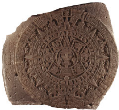
Piedra del Sol, cultura mexicana, conocida con el nombre de Calendario Azteca.