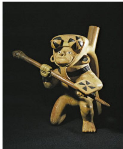
Vaso que representa a un guerrero moche.

Entra al portal Primaria TIC: http://basica.primariatic.sep.gob.mx . En la pestaña Busca, escribe Chavín, Nazca, Moche o Huari .