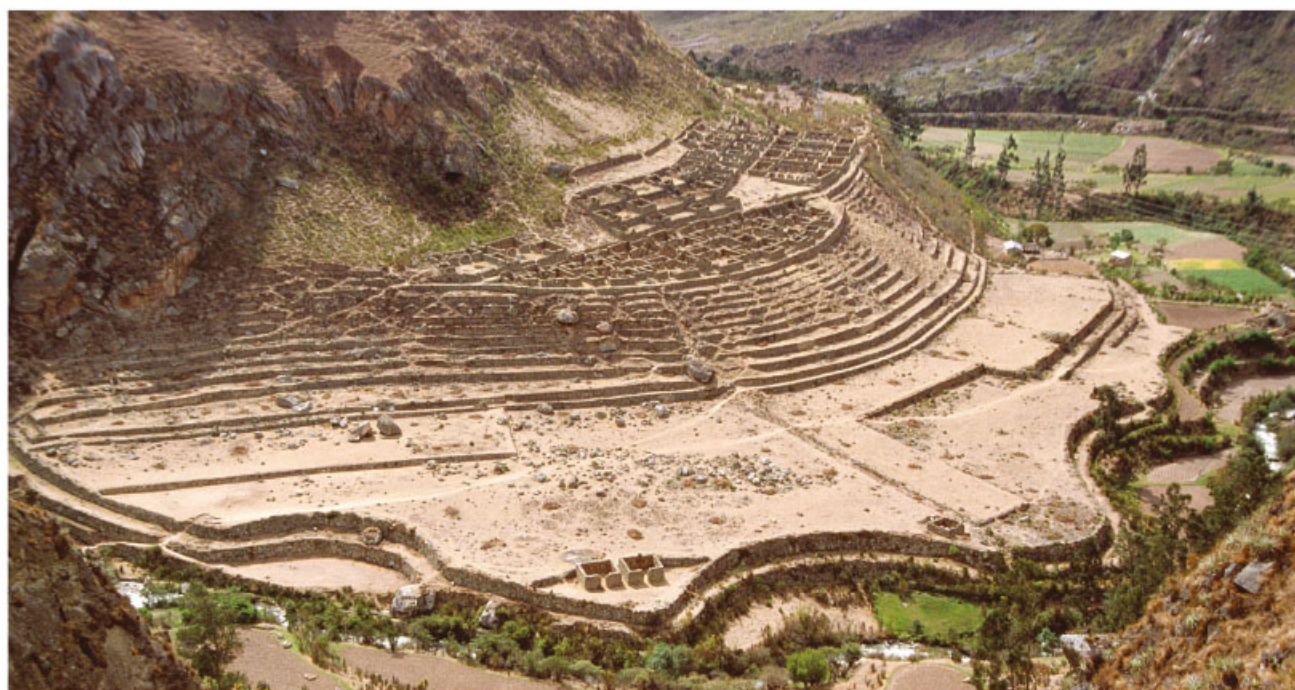
Camino inca, ruinas de Llactapata, Perú.

Entre sus principales cultivos estaban el maíz, la papa y la coca, planta cuyas hojas se usaban en las ceremonias religiosas y posiblemente para adaptarse a la altura, pues algunos de sus territorios estaban a 4 000 metros sobre el nivel del mar.