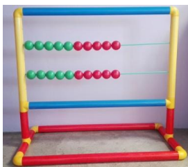
ÁBACO GIGANTE MODIFICADO